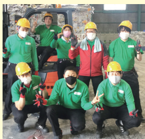
「ハートコープあいち」のみなさん

小牧市にあるコープあいちの特例子会社「ハートコープあいち」では、主にコープあいち、コープぎふ、コープみえの3つの生協から回収した商品案内(カタログ)や紙の注文用紙を、10人の障がいのある社員が圧縮・加工して資源リサイクル業者に売却する事業を行っています。協力し、助け合いながらみんなが輝ける社会の実現をめざしています。